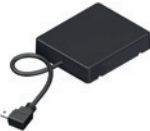
NOVOFERM HOMEMATIC IP MODUL