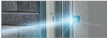
LICHTSCHRANKE FÜR GARAGENTORE